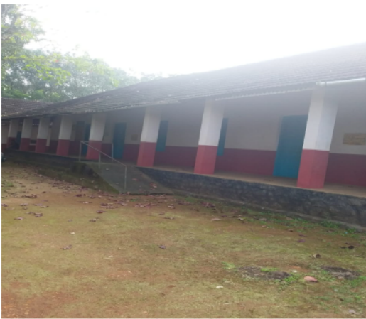
Polling Station Building Front View